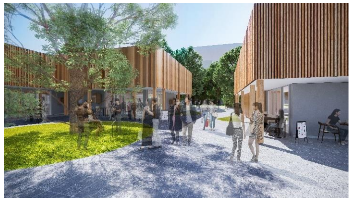
商業施設およびひろしまこみち（仮称）のイメージ