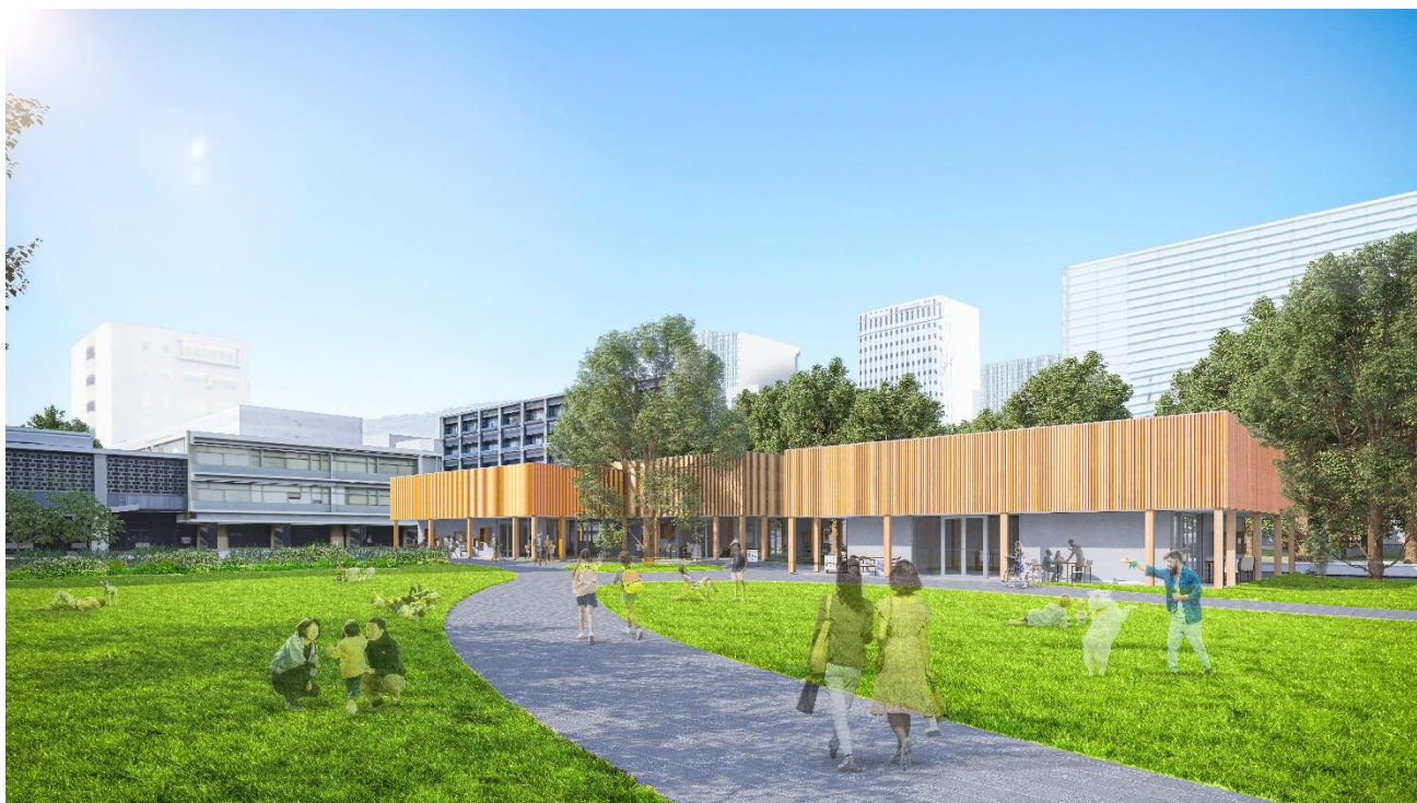
敷地西側の通り(鯉城通り)からの外観イメージ

「広島県庁舎敷地有効活用事業」(以下、本事業)を推進する事業者「MOTOMACHI CONNECT」(代表法人:NTT 都市開発株式会社(以下「NTT 都市開発」、構成法人:NTT アーバンバリューサポート株式会社、デイ・ナイト株式会社、日本駐車場開発株式会社、アマノマネジメントサービス株式会社)は、このたび広島県広島市中区基町10番52号(広島県庁舎敷地内、以下「本計画地」)において、テラスを有する木造平屋の商業施設、および芝生広場の工事に着手しますのでお知らせいたします。なお、開業は2025年春を予定しております。