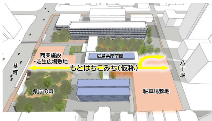
もとはちこみち（仮称）のイメージ（鳥瞰図）