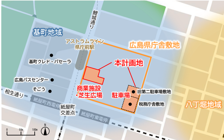
県庁舎敷地周辺図

本計画地には、商業施設として木造平屋建物を2棟建設し、その北側に芝生広場を整備することに加え、新たに駐車場（約165台）を整備します。