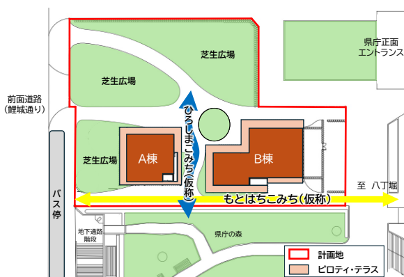
ピロティ・テラスと各こみちの位置図

また、本計画地の外と繋がる“こみち”を計画しております。商業施設の間を南北に通る“ひろしまこみち”（仮称）を整備することで芝生広場と県庁の森とを繋ぎ、商業施設ならびに県庁利用者の誰もが自由に使える憩いのスペースを創出します。